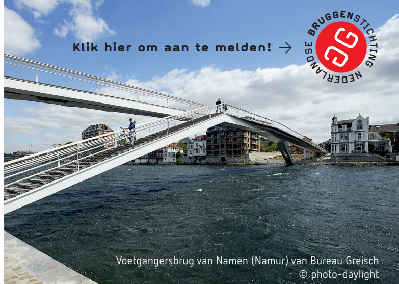
Voetgangersbrug van Namen (Namur) van Bureau Greisch