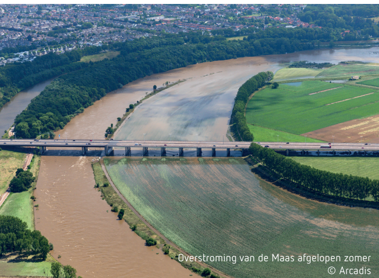
Overstroming van de Maas afgelopen zomer